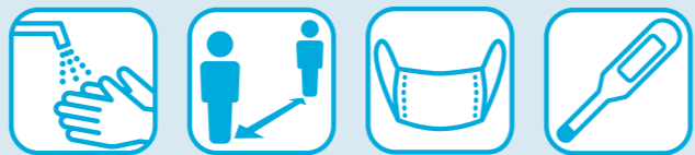
代々木ゼミナール造形学校は、受験生が安心して制作できる環境づくりに努めています。