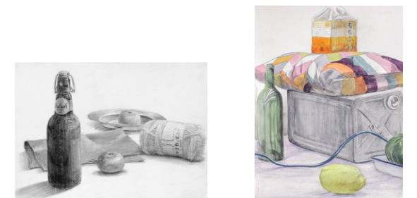
総合芸術高校 合格再現作品