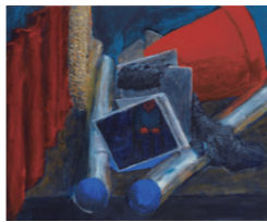
武蔵野美術大学 油絵学科 油絵専攻