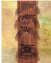
多摩美術大学 絵画学科 油画専攻