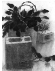
武蔵野美術大学 油絵学科 油絵専攻