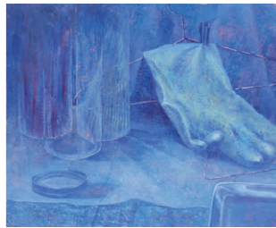
武蔵野美術大学 油絵学科 油絵専攻