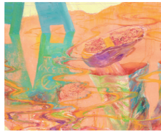
多摩美術大学 絵画学科 油画専攻