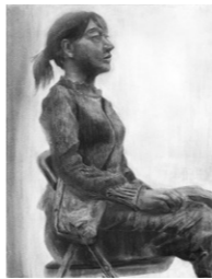
多摩美術大学 絵画学科 油画専攻