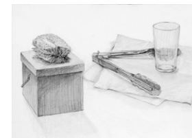
総合芸術高校 合格者作品