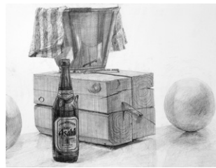
経験者スケジュール 静物デッサン 形態 構図・構成 立体感 固有色 材質感 空間感 発想