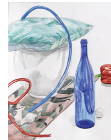
総合芸術高校対策 授業作品