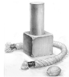
初心者スケジュール 静物デッサン 形態 構図・構成 立体感

デッサンを学ぶには漠然と描いてはなかなか上達しません。造形学校ではデッサンを学ぶための大切な7つの項目を掲げています。デッサン初心者には、この7つの項目を無理のないところから段階的に始め、デッサン経験者は7つの項目を組み合わせた課題を描き重ねることで、それぞれ実力をつけていきます。