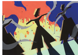
武蔵野美術大学基礎D 合格者作品